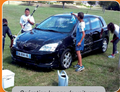
Opération lavage de voitures