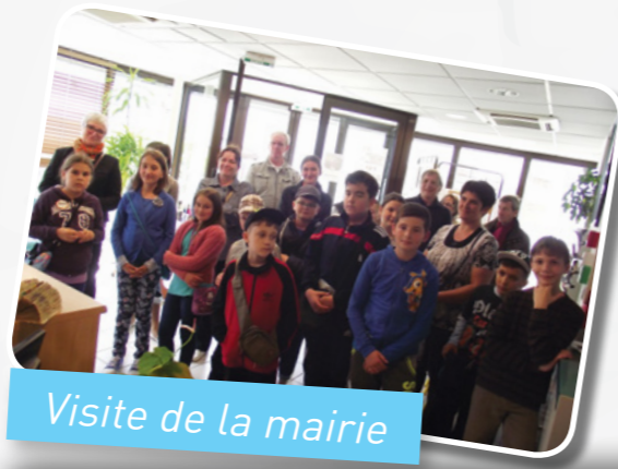
Visite de la mairie