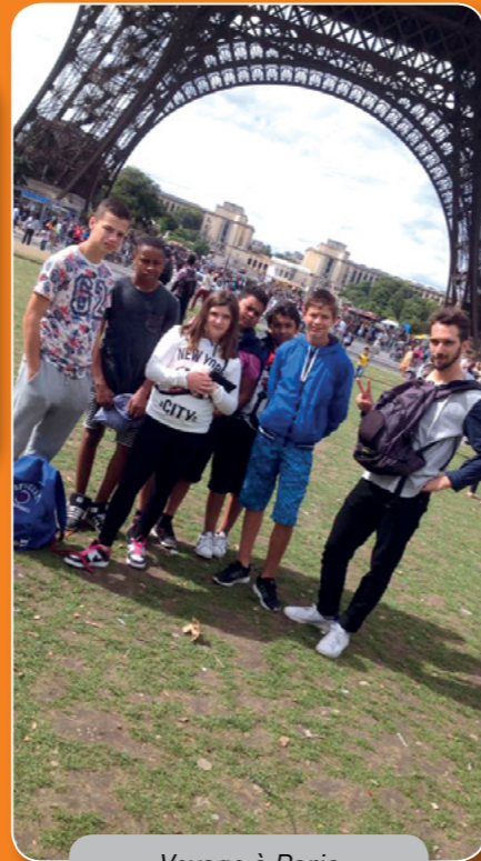
Voyage à Paris