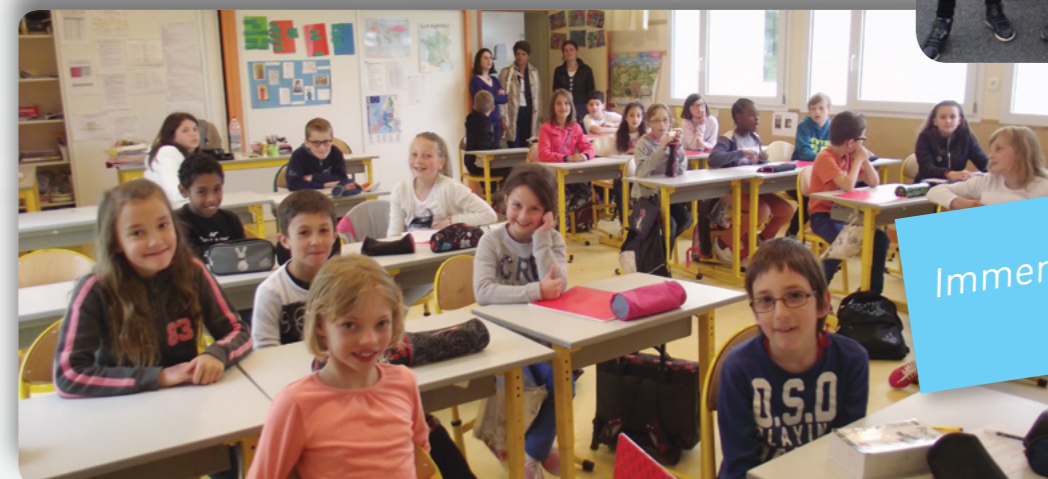
Immersion dans l'école Marco Polo