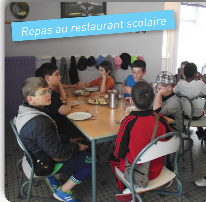
Repas au restaurant scolaire