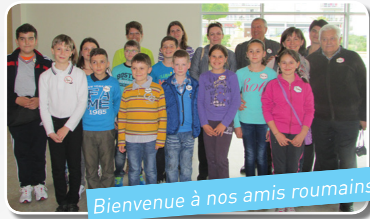
Bienvenue à nos amis roumains

Un échange riche, intense, plein d'émotion que l'on espère prolonger en continuant les échanges par Webcam dans un premier temps, et par la suite emmener nos enfants et enseignants découvrir ce beau pays, la Roumanie.