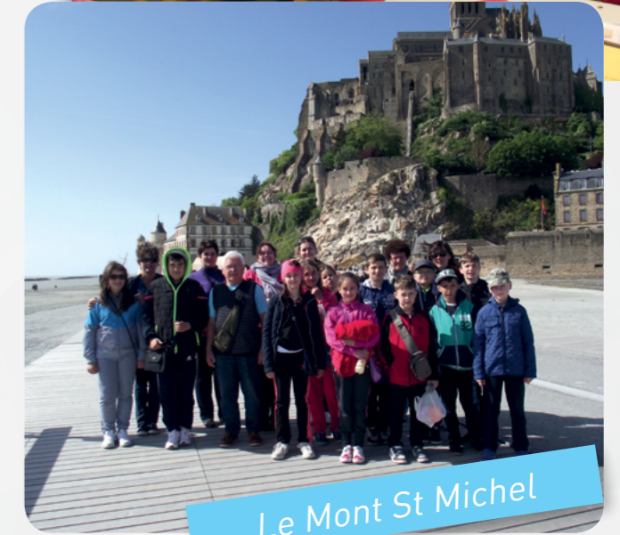
Le Mont St Michel