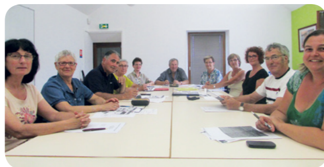
Le CA du CCAS se réunit environ 4 fois par an selon les dossiers et la mise en place des actions.

Pour les familles : aides financières ponctuelles selon les situations sociales, aides alimentaires, formation aux premiers secours,