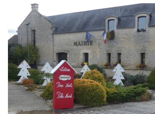
Boîte aux lettres du Père Noël

À chacune et chacun d'entre vous, je souhaite un très joyeux Noël et une belle fin d'année.