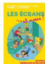
Livret « Les écrans et nous en familles préservons notre santé »

Outils à retrouver sur ce lien : https://normandie.mutualite.fr/dossiers/les-ecrans-et-nous/