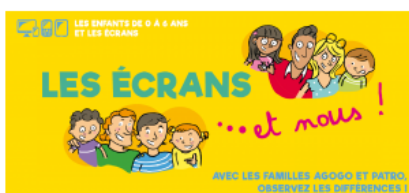
Livret « Les écrans et nous-0 à 6 ans

D'autres outils, dont ceux de la Mutualité française Normandie, sont à votre disposition au RAM pour échanger avec vos proches sur cette question :