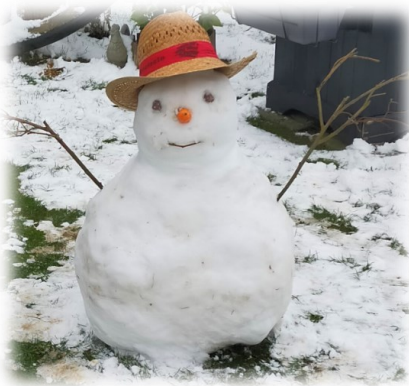
Le bonhomme de Gaspard et Stéphane

Un tapis blanc nous a surpris juste avant les fêtes. Il a généré une inspiration hivernale variée dont j'ai reçu plusieurs