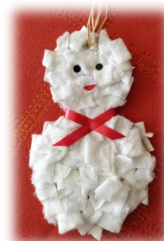
Le bonhomme d'Anatole, Marius, Céleste et Sylvie