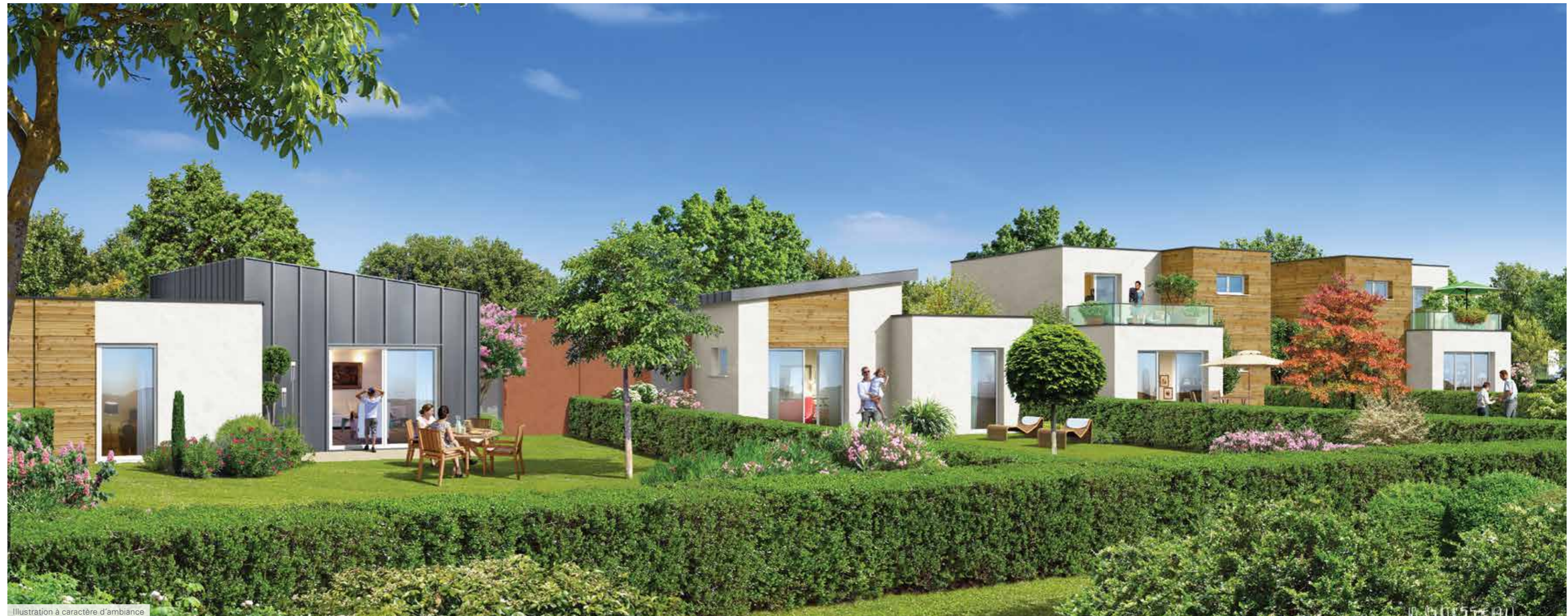
Illustration à caractère d'ambiance

Chaque maison dispose également d'un garage individuel avec des espaces de rangement et une place de stationnement extérieure supplémentaire.