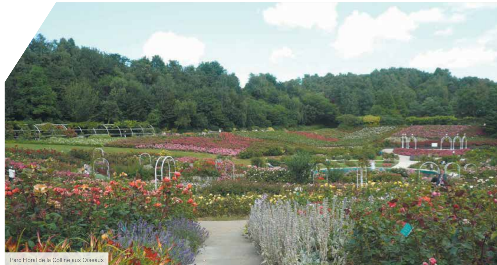
Parc Floral de la Colline aux Oiseaux

Depuis la rue de la Poterie, les mails piétonniers arborés parcourent l'ensemble du "Domaine" et mènent aux maisons, aux immeubles intimistes et aux parcelles à bâtir. Tout en douceur, l'architecture de ces réalisations permet à l'ensemble de se fondre harmonieusement dans son environnement verdoyant. La vie sereine au sein de ce hameau vous invite également à rejoindre les commerces et services à pied par les cheminements piétons qui desservent "Le Domaine".