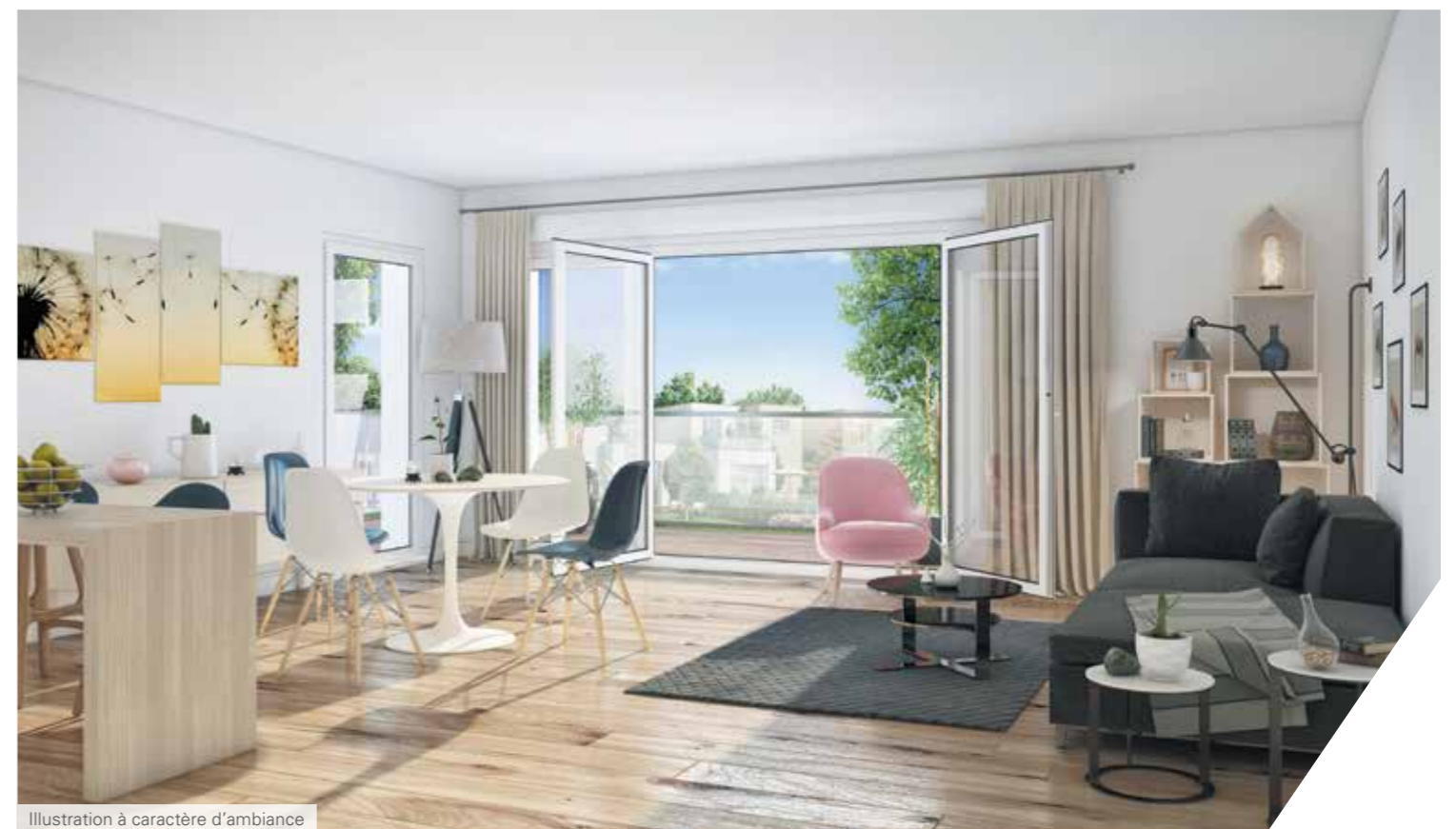
Illustration à caractère d'ambiance

Les immeubles intimistes du "Domaine" affichent une architecture contemporaine où les tons clairs illuminent les façades. Au rez-de-chaussée, un support de plantes grimpantes crée l'illusion d'une construction suspendue au-dessus d'un massif végétal. En étage, les balcons et terrasses rythment les lignes de l'immeuble tandis que les matériaux de qualité tels que le bois et le verre apportent leurs notes élégantes. Les espaces verts qui entourent et ornent les immeubles accentuent enfin la personnalité verdoyante de cette réalisation si agréable à vivre.